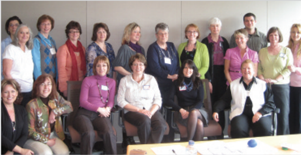
Participants à la réunion du 25 mars de la coalition communautaire